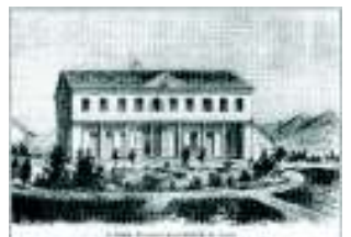
Heinrich, a Szent