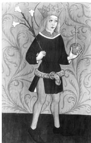
Szent Imre kép (Csiksomlyó)