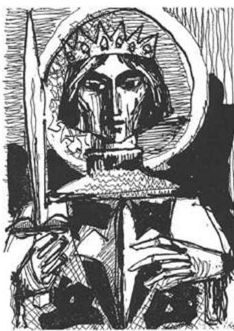
Szent Imre (Prokop Péter)