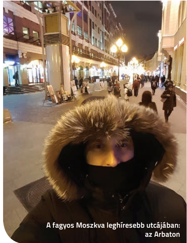
A fagyos Moszkva leghíresebb utcájában: az Arbaton

3 évet dolgoztam a Közel-Keleten Szaúd-Arábiában. Amikor visszajöttem valahogy a GSK-hoz keveredtem. Magyarország után Moszkva jött 3 és fél évig, aztán 2 év Anglia következett. A Moszkvai lehetőséget viccesen úgy közöltem mindenkivel, hogy ez az én kompenzációm, a szaudi sivatagért kapom a fagyos Moszkvát. Sok tapasztalatot gyűjtöttem a gyógyszeriparban, a nagykereskedés, a gyártás, a kutatásfejlesztés területén. Mindegyiknek megvolt a maga varázsa, ugyanakkor a kereskedelem mindig is közel állt hozzám, érdekelt, hogyan lehet az üzletet előre vinni. Amikor a gyógyszeriparba kerül-